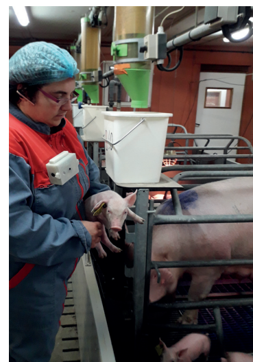
Le boîtier est fixé au vêtement de l'éleveur, qui garde ainsi les mains libres